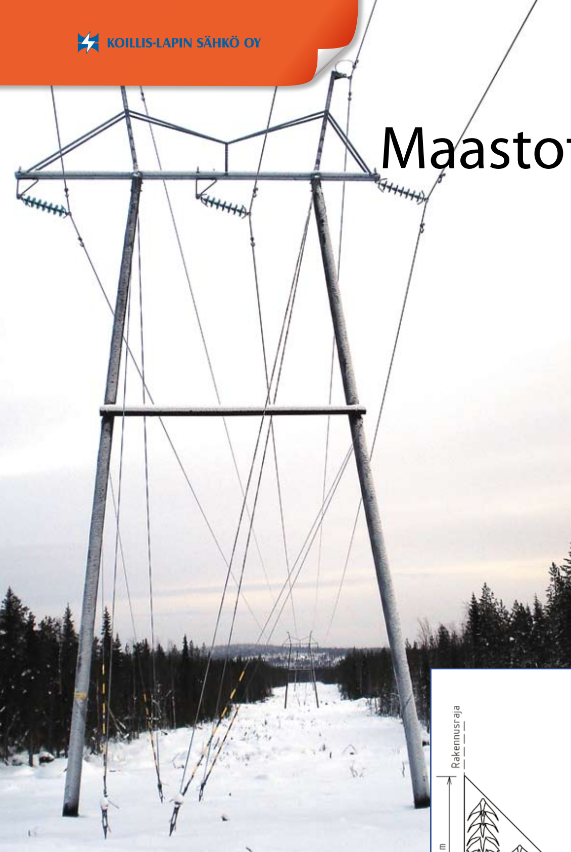
Isokero-Pelkosenniemen välille suunniteltu 110 kilovoltin linja on rakenteeltaan samanlainen kuin Kursun ja Sallan välille rakennettu voimajohto.

- Lunastuslupahakemus jätetään huhtikuun alkupuolella. Hakkuurajat ja pylväspai-