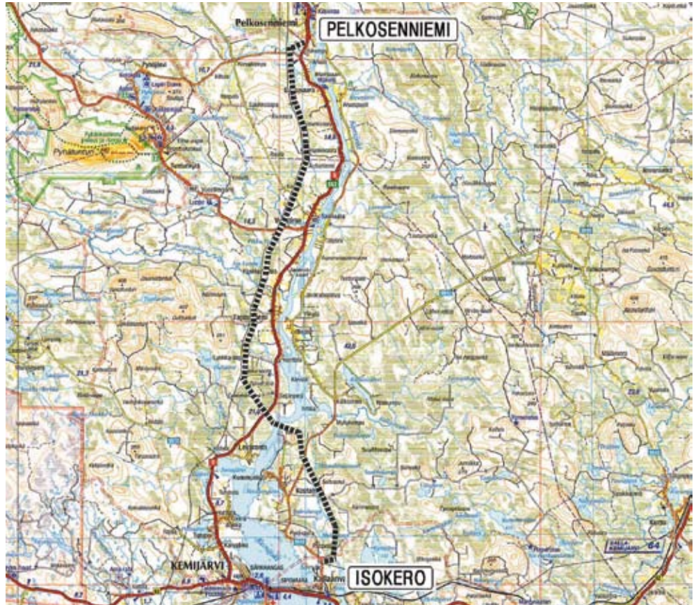
Voimajohdon pituus on noin 46 kilometriä. Kostamon itäpuolitse Varrion kylän pohjoispuolella Kemijoen ylittävä johto tulee turvetuotantoalueen länsipuolella kantaverkko-yhtiö Fingrid Oyj:n 220 kilovoltin johdon rinnalle.